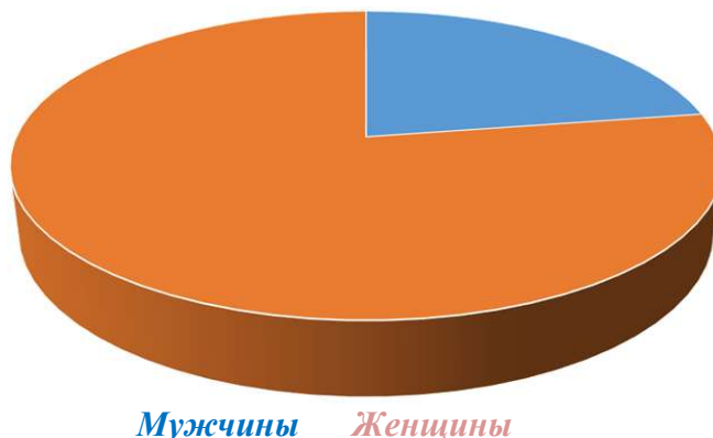
Рис. 2. Соотношение лиц, подвергшихся насилию

Важным направлением деятельности противодействия насилию является защита детства.